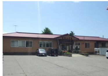
男鹿市船越支所 船越公民館