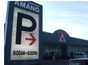
スーパーセンターアマノ