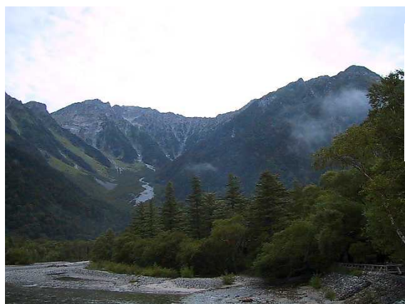
左)河童橋よりの穂高連峰 右)明神よりの明神岳 下)サラシマシヨウマ

雨の中の登山であり精神的に疲れる。また、ザックの中の着替えも濡れてしまった。 槍沢に、雨で沢からの水が滝となって落ちていた。小さい沢を渡るのも増水で靴が水に埋まる。 高山植物はシーズンを少し過ぎていた。