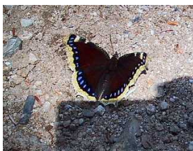
左上)明神で咲いていたウツギ 中央)槍沢ロッジ・キベリタテハ 左下)明神橋と梓川 下) 嘉門次小屋の囲炉裏 右) 雨の中に登った槍岳山荘