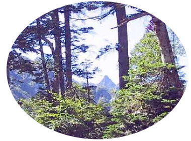
槍沢ロッジからの槍ヶ岳